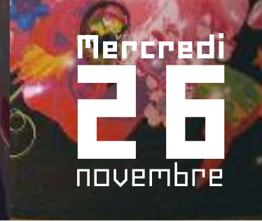
TABLE RONDE 1