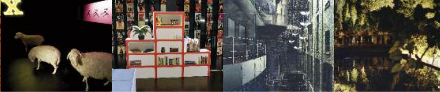
TABLE RONDE 2